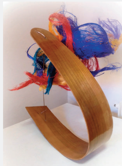
Une harpe éolienne (merisier, cuivre et fibres végétales, 65x62x15)