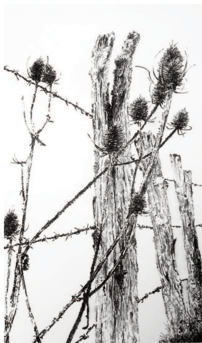
Cardé es 5