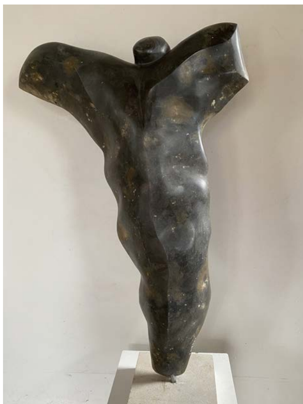
« Lange »