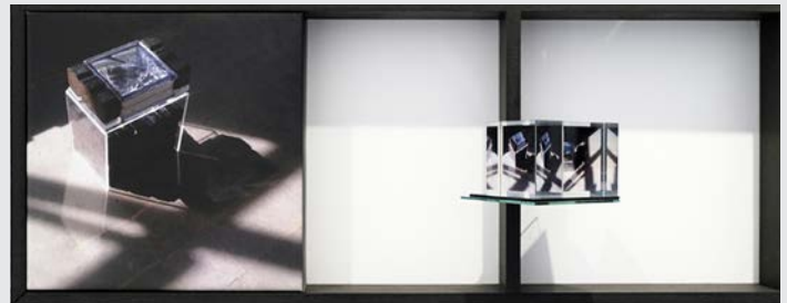
« Vous êtes ici chez moi »

Ses travaux artistiques se donnent à voir comme une mise en motifs des points de passage entre espaces et objets.