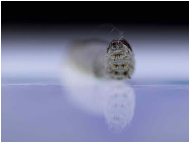
« Bois blanc et branchages morts »

Sous le halo des caméras, brindilles et vers à soie dressent leurs insolentes graphies. Sur des toiles virtuelles, au ralenti et hors échelle, ils dessinent l'espace d'un tiers paysage pour en parfaire l'écrin.