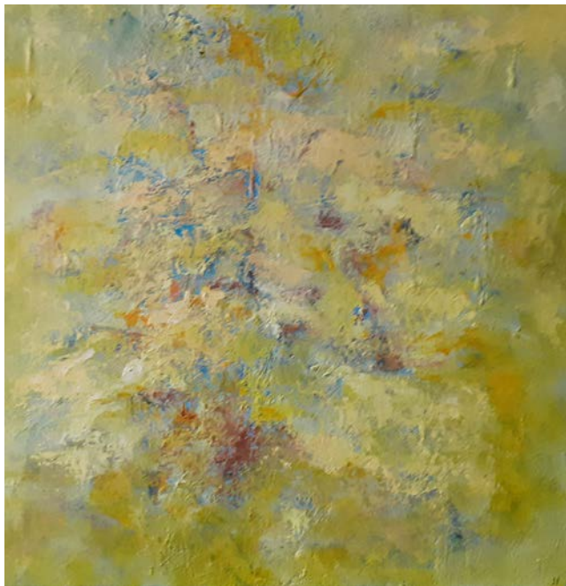
« 13-04-20 »

L'espace et la lumière y sont source d'intérêt. Je me situe le plus souvent entre la figuration et l'abstraction en laissant des signes d'identification mais je m'évade parfois dans des expressions abstraites. L'essentiel est d'exprimer ce que l'on ressent.