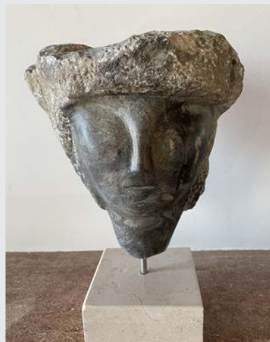
« Tête noire »