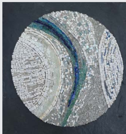
« Sans titre »

Les créations sont propices à la méditation et à l'évasion, sensibles aux dons que la nature nous a impartis. Rien n'est figé, continuellement en mouvement même infime, certaines oeuvres semblent vibrer d'autres s'effacer pour mieux renaître.