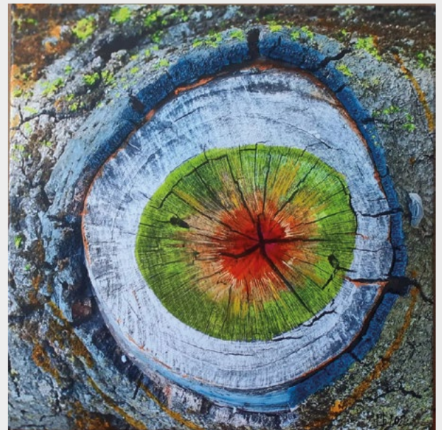
Série Branches coupées « La cible », technique mixte, 2022, 40x40 cm

Elle questionne le rapport de l'Homme à la/sa nature, la frontière entre le naturel (produit par la nature) et l'artificiel (fait par l'homme). Elle invite à regarder au-delà des apparences afin de mieux identifier la nature des images et de ce qui nous entoure.