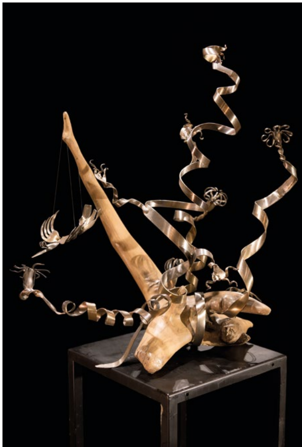
« Colibri », bois et inox, 60x50x60 cm

Dans une démarche primitive et opportuniste, où les matières sont celles dont elle dispose sur le moment, elle y puise par des procédés empiriques, une poésie insoupçonnée. Et c'est lorsqu'elle sent une harmonie se dégager du mélange des formes, des matières et des équilibres que son âme est seraine... et l'œuvre achevée.