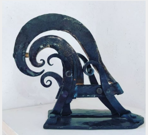
« Sans titre »

En fonction des moments, vous aurez l'occasion d'écouter mes créations sonores en même temps que vous découvrirez l'exposition... pour une visite entre rêve et matière, entre courbes et lignes, entre visions et illusions .