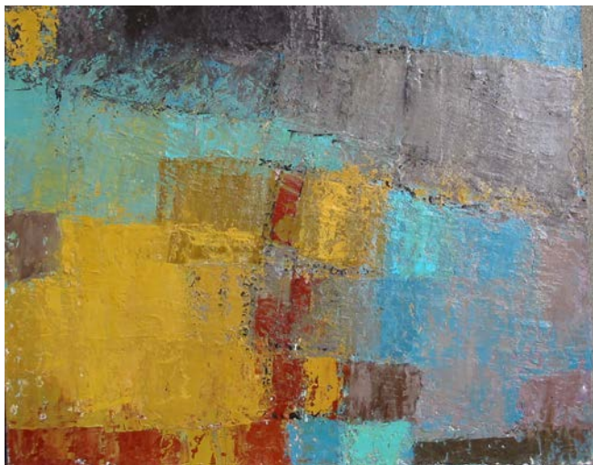
« Sans titre »

C'est un interminable dialogue entre moi et le tableau, jusqu'au moment où il ne faut plus intervenir si je ne veux pas perdre toute la fraîcheur du tableau.