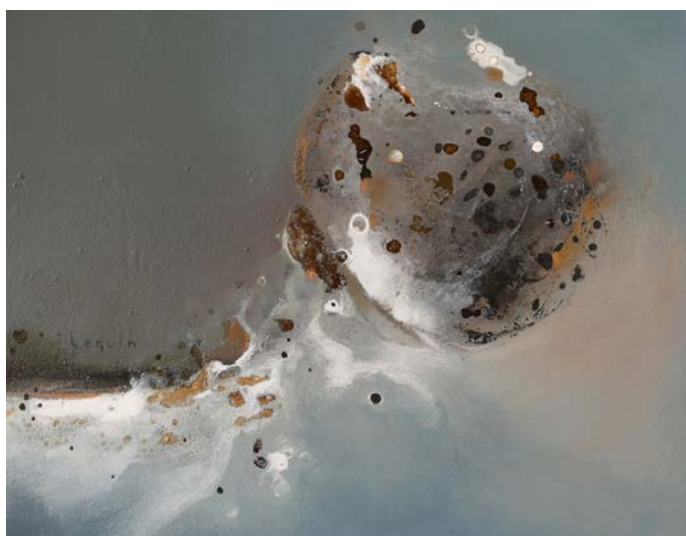
« Détail des Mange-Colère »

C'est davantage une transfiguration du réel que le réel lui-même qui m'attire dans le travail de création.