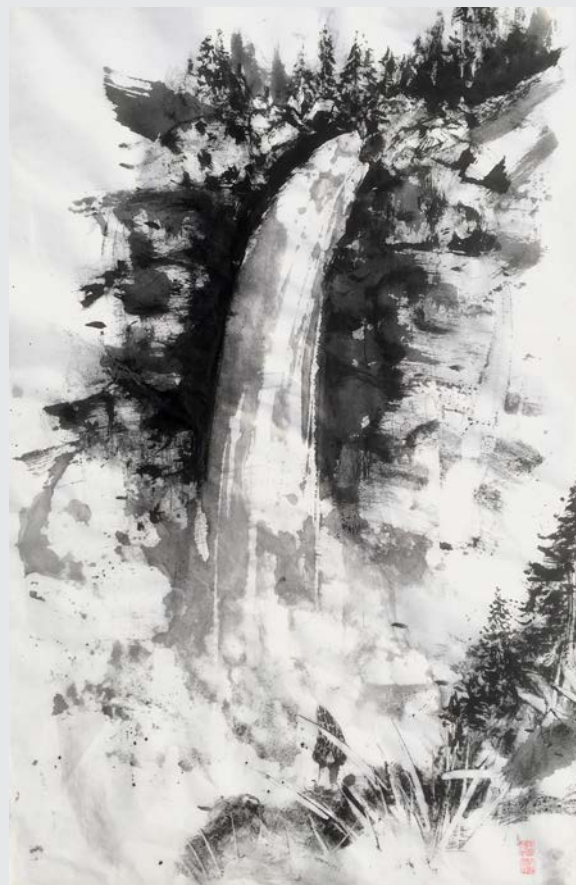
« Jour de pluie »