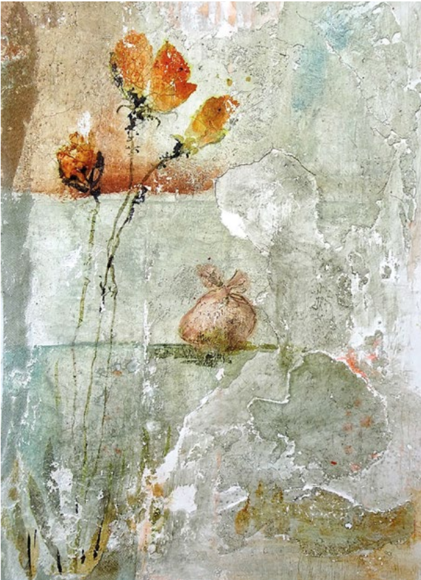
« Le baluchon »

«Peu importe le temps, pourvu qu'il y ait l'éternité ...»