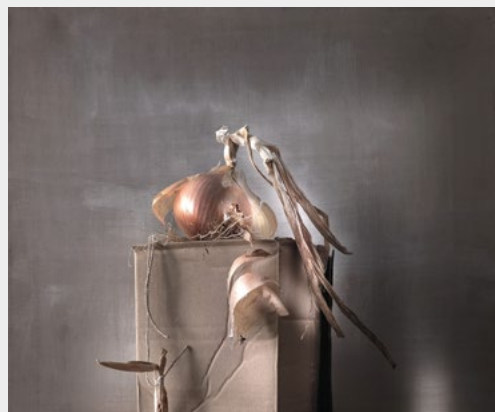
« Sans rendez-vous »