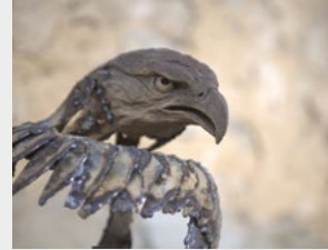
« Sculpture », 2024

17 la grande rue, 30330 LA BASTIDE D'ENGRAS