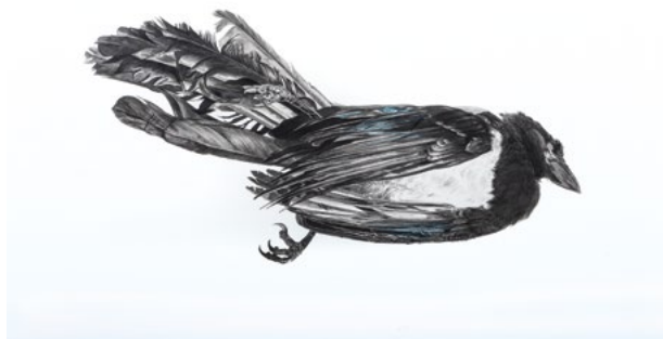
« La pie », encre de chine sur papier maroufflé sur toile

Samuel Cordier, extrait du texte de présentation de l'exposition « Le silence des oiseaux »