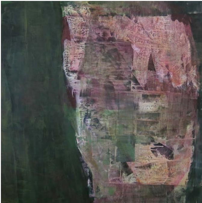
« Sans titre série des Maps »

Depuis 2019, je reviens à une abstraction plus radicale (Dynamique du silence 2, Dynamique de l'espace, Maps) parallèlement à des intrusions dans la figuration (Fleurs, insectes, cocons...).