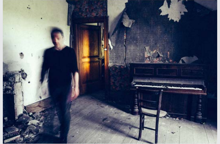
« Autoportrait »