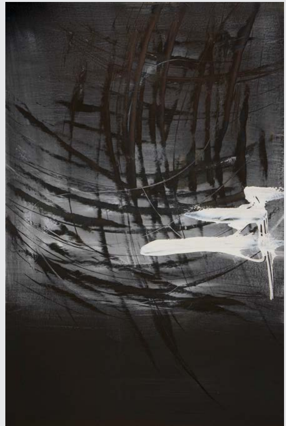
« Sans titre »