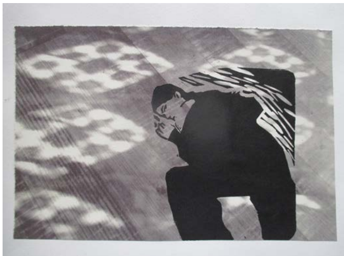
« Tout doit disparaître »