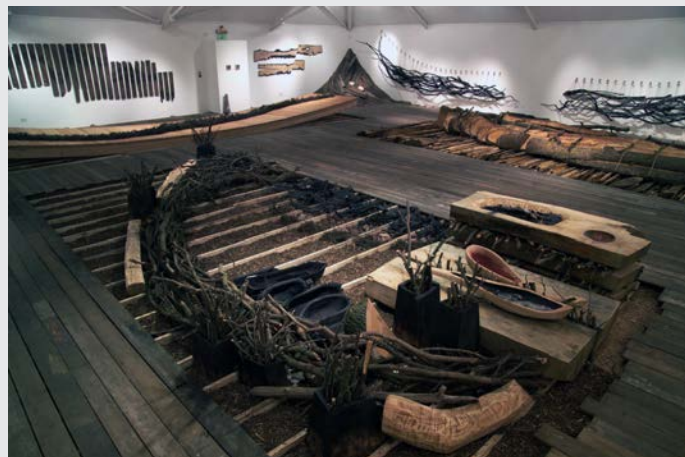
« Salvage ynys mon »

Il utilise souvent des matériaux recyclés, créant des pièces allant de la petite à la grande échelle, traitant de thèmes allant de l'abstrait au politique.