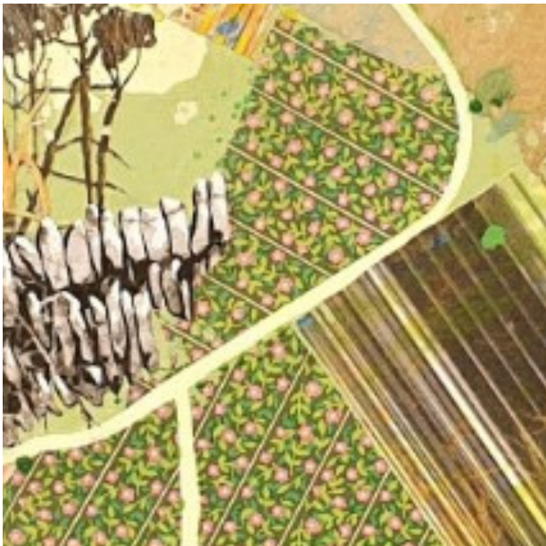
« Neuilly »

Ces lieux l'inspirent et réveillent en lui des souvenirs d'enfance qui le conduisent dans un voyage panoramique à travers un paysage retrouvé et poétique.