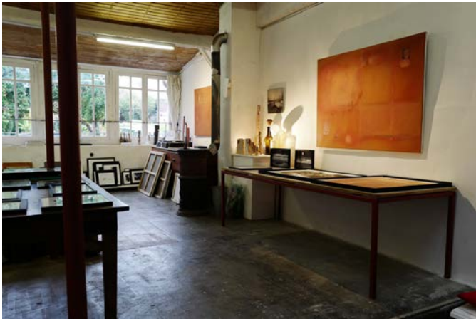
« Sans titre »