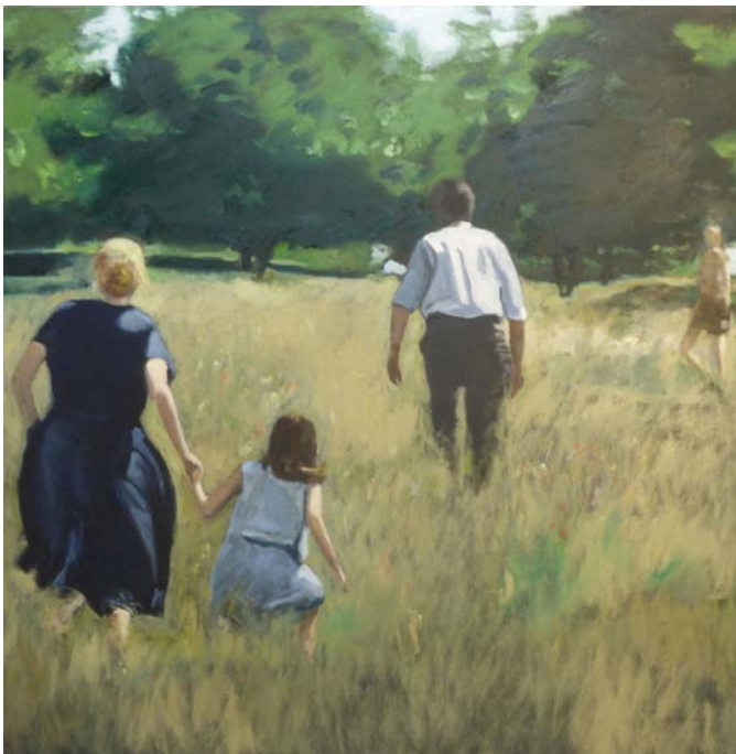
« Sans titre »

« La peinture d'Alain Steck explore les traces de perte de substance d'un monde réel photographié en un instant donné, en un lieu donné; ces traces qui nous échapperaient si justement la peinture n'arrêtait pas notre regard alors retenu et affecté. Un travail pictural en vue de sa définition et de son émergence le transforme en apparition. »