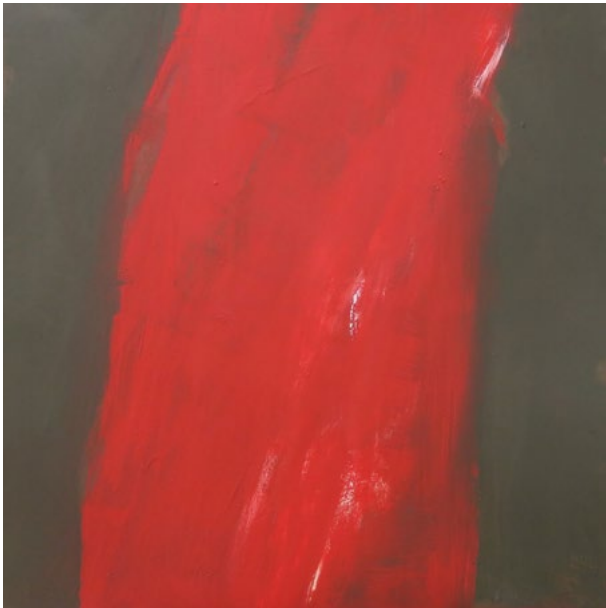
« Série Formes n°2 »

Si je dois revendiquer une influence, elle est du côté des abstraits américains et d'Olivier Debré.