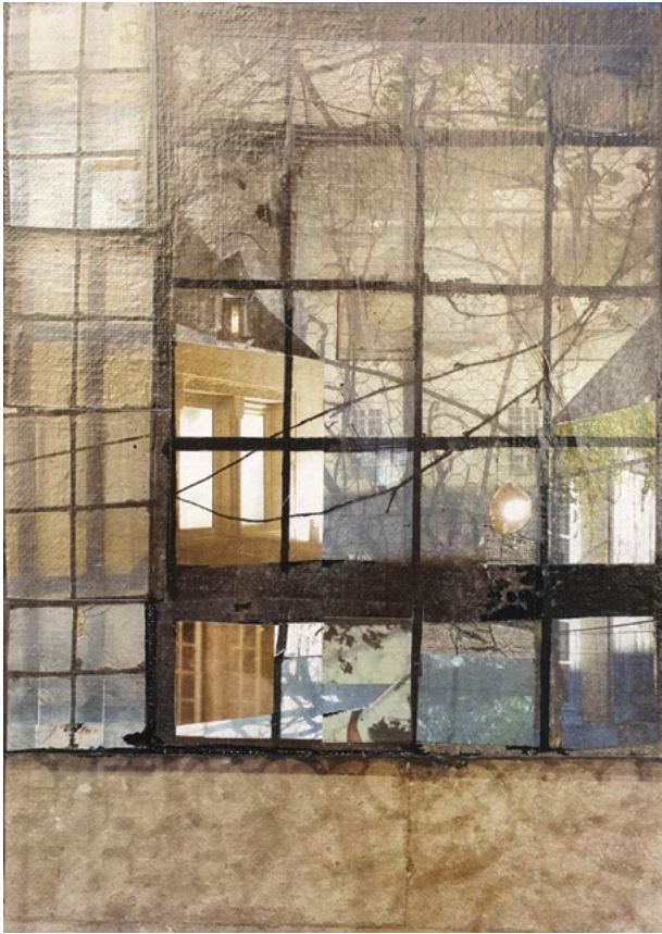
« Nuit d'hiver », collage et acrylique sur toile, 2024, 19x27 cm

Ces lieux l'inspirent et réveillent en lui des souvenirs d'enfance qui le conduisent dans un voyage panoramique à travers un paysage retrouvé et poétique.