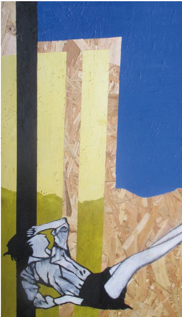
« Au bout du rouleau », monotype, 30x40 cm