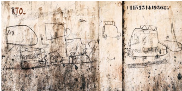
« Dessins d'enfants », photographie