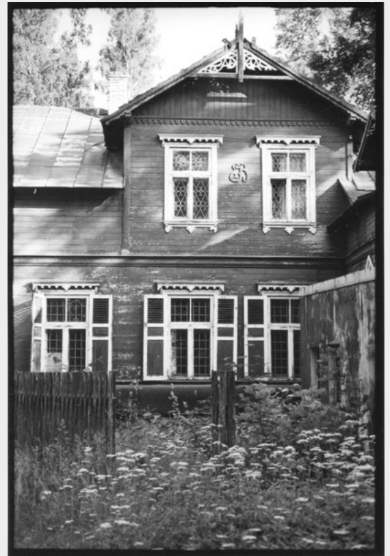
« Baltes »

Photographies réalisées en juin 2022. C'est un voyage argentin de 5 000 km de routes bordées de forêts interminables, sans rencontrer de village, au travers des trois pays Baltes : Estonie, Lettonie, Lituanie. Nous avons été à la recherche de vestiges soviétiques, villages abandonnés, mais aussi des villes pleines de vies. Ces petits pays sont riches de leur patrimoine culturel marqué par les différentes influences.