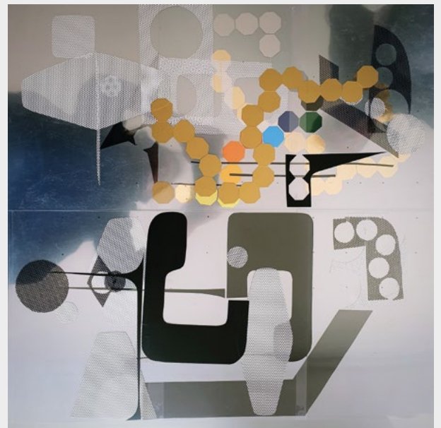
« Sans titre », 100x70 cm

Ses constructions abstraites, organiques, sont composées de matériaux divers, de l'arbre. Le monde végétal reste présent dans cette création : entre apparition et disparition, les silhouettes, de grandes herbes folles, une ombre de l'humain. Il évoque ce qui reste.