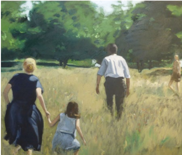
« Sans titre »

« La peinture d'Alain Steck explore les traces de perte de substance d'un monde réel photographié en un instant donné, en un lieu donné; ces traces qui nous échapperaient si justement la peinture n'arrêtait pas notre regard alors retenu et affecté. Un travail pictural en vue de sa définition et de son émergence le transforme en apparition. »