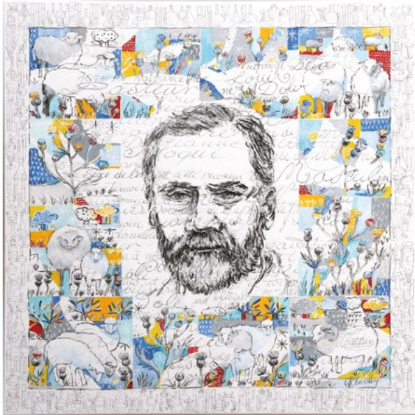
« Louis Pasteur n°7 - Espoir infini en hommage à Louis Pasteur », acrylique et collages sur toile, 2023, série « Mémoire de Beaux-Arts » 100x100 cm

Ces deux séries distinctes s'alimentent et s'enrichissent l'une l'autre pour construire mon propre cheminement et poser cette question : qu'est-ce que la création ?