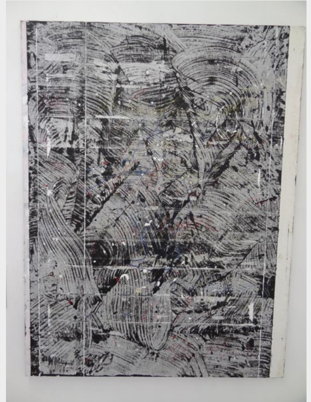
« Noir et blanc »