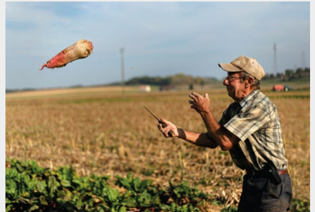
« La Ferté », photographie, 2018