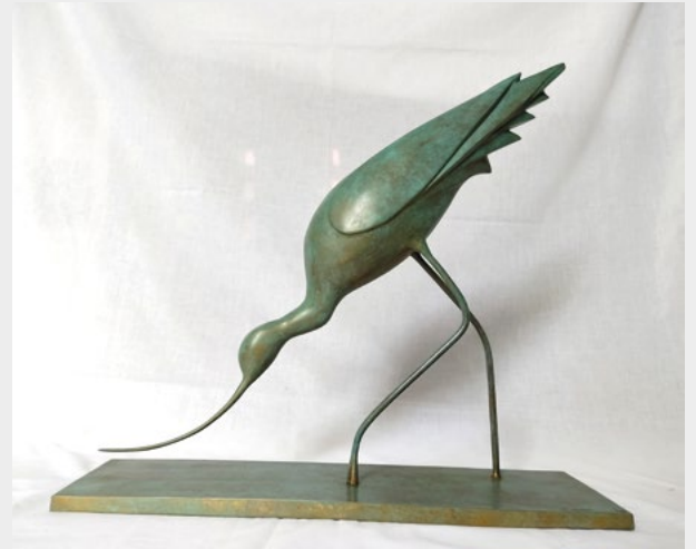
« Avocette élégante », hauteur 52 cm

2 impasse des mésanges, 70400 CHÂLONVILLARS