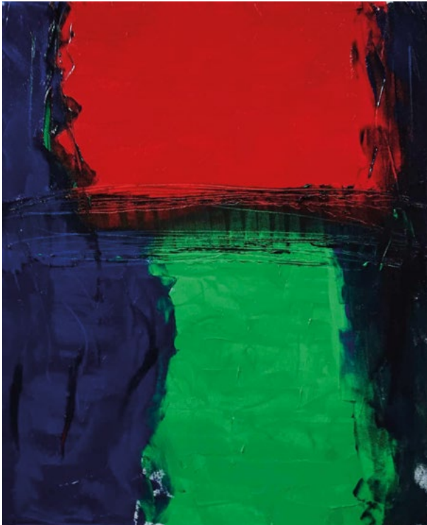
« Situation », 2023, 46x55 cm

"À la recherche d'une dimension spirituelle, l'étendue, l'espace, la lumière, la mythologie du nord. Peinture au-delà de l'expression naturaliste, peinte, semble-t-il, avec une sérénité sereine."