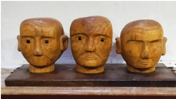
« Carcan »

J'aime donner une seconde vie à des morceaux de bois voués au feu ou au pourrissement. J'alterne, autant que possible, les essences, les tailles et le style de mes créations. Chacune d'elle est une rencontre entre une matière vivante, le bois, son vécu et le mien. Adeptes de la taille directe, les heures d'ébauche, en pilote automatique, me permettent de nourrir ma réflexion sur le sujet choisi, parfois d'en changer, au fil des rencontres plus ou moins heureuses qu'offre cette matière.