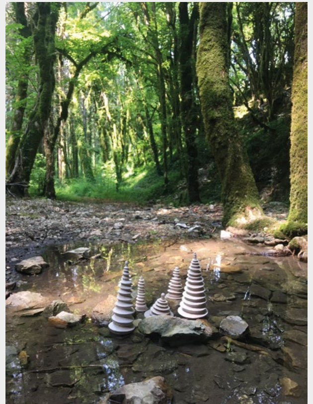
« Reprise »

La matière est source d'inspiration autant que le projet artistique que l'on a pour elle. Cette aventure m'enchanté depuis de longues années.