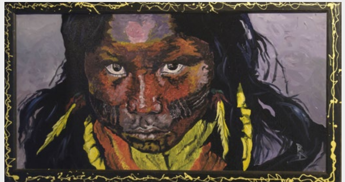
« Yuma »

Pendant plusieurs décennies passées de pays en pays, Didier BOSSU a emmagasiné des images d'enfants, d'adultes, ou d'animaux. Ses peintures à l'huile, son style qui lui est propre restituent ce qu'il a vu, parfois de manière crue, sans fioritures. L'intensité des regards de ses sujets vous transpercera.