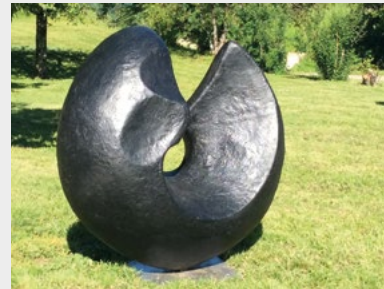
« Libération »

Jean Louis BOUCON a un passé de peintre. L'utilisation toujours plus importante de matière dans ses toiles l'amènent à se tourner vers la sculpture. Pour l'étude, ses mains modèlent la terre et matérialisent ses ressentis. Sculpter devient pour lui son moyen d'expression.