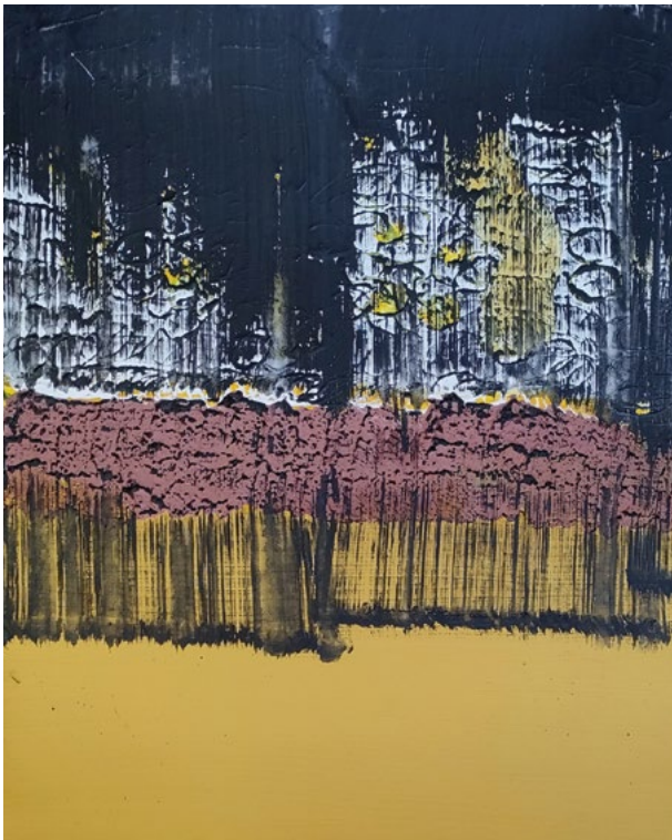
« Sans titre »

Le plaisir de peindre, de s'étonner lui-même dans une totale liberté d'expression. Depuis un an il cultive le moins. Peintures abstraites graphiques à tendance minimaliste. Tout en cultivant le plus. Peintures denses dont on peut trouver des traces de figuration : traces de paysages, traces humaines ou animales. Deux mondes opposés dans lesquels il valse, conscient du bien-être que cela lui procure. Une thérapie en quelque sorte.