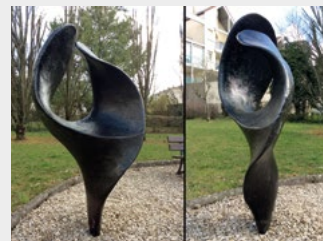
« Grue »

14A chemin de l'espérance, 25000 BESANÇON