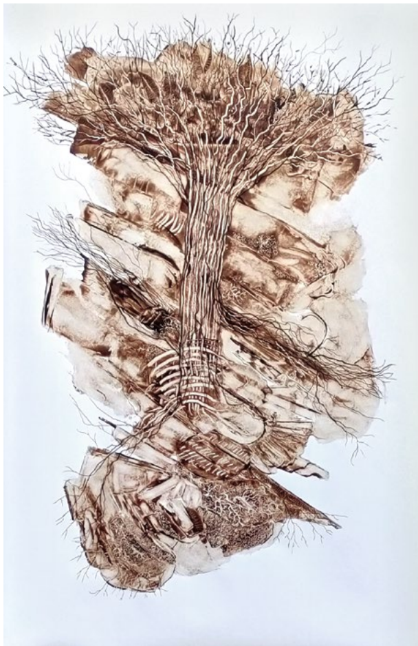
« Petite suite ou le monde du Vivant », peinture monochrome, 2024, papier, 150x100 cm

On retiendra sa série « Petite suite ou le monde du vivant ». On reverra volontiers les toiles colorées qui ont précédé ce travail monochrome, lesquelles étaient initiatrices de ce thème qui lui est devenu non seulement source d'inspiration mais indispensable à sa création « le monde du vivant ». DMFP