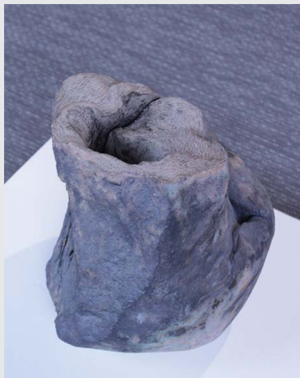
« Sans titre »

Les pièces installer ensemble communiquent, se parlent. Tel une constellation, ou une galaxie nous venons tourner autour, se rapprocher, les écouter.