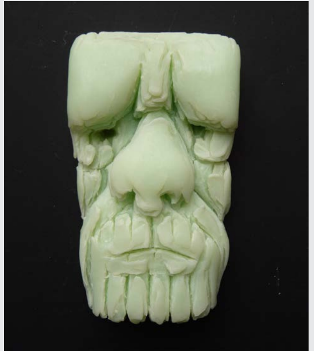
« Purification »