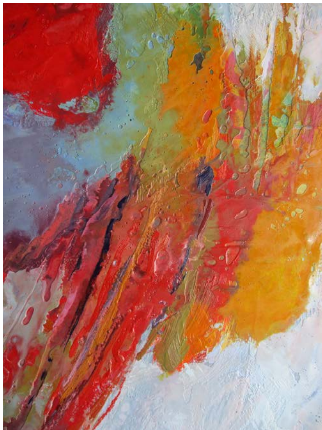
« Rouges primaires »

Artiste autodidacte, je réalise des peintures à la limite du figuratif et de l'abstraction lyrique. Au moyen de l'encaustique permettant des effets empâtés ou transparents, j'essaie de magnifier la nature environnante et valoriser des sujets d'une grande banalité comme les roches calcaires, les branchages ou les reflets sur l'eau.