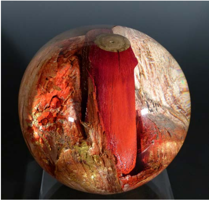
« A coeur ouvert »