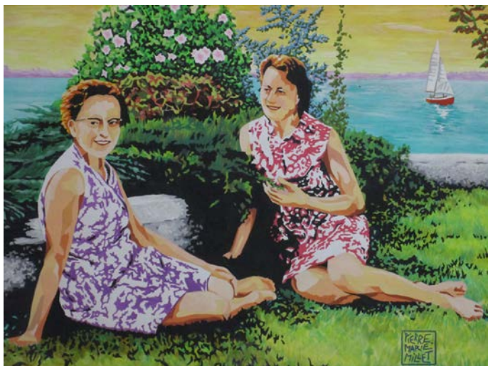
« Tatas »