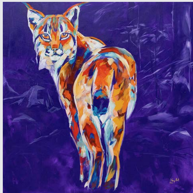
« Aiguille »

et les émotions que j'ai à leur approche. Les galeries en France et à l'étranger qui me font confiance depuis toujours ont su relayer ma passion et mon engagement pour une figuration différente. Grâce à elles, mes oeuvres sont aujourd'hui présentes dans de nombreuses collections partout dans le Monde.