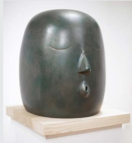
« Le Souffle » - Résine et Bronze »