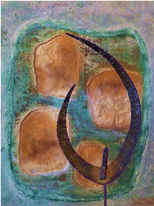
« Terre / Univers II »

Alain Plésiat développe ses créations en établissant un dialogue permanent et original entre le sable et fer, dialogue qui ouvre sur une réinterprétation contemporaine du sens profond de « l'inerte ». Ses tableaux de sable composés avec des minéraux naturels sont autant de fragments de sols ou de parois qui racontent des histoires millénaires : matières brutes en équilibres instable ou en mouvement, empreintes laissées sur le sable par des objets déposés par le vent ou les courants marins, écritures et traces éphémères gravées par la main de l'Homme... De cet univers minéral s'évadent des objets énigmatiques en métal oxydé dont l'origine reste incertaine. Ces sculptures s'inspirent d'échouages imaginaires, de réalités en errance qui rappellent à beaucoup d'égards les itinéraires, les transformations et les fractures du vivant.