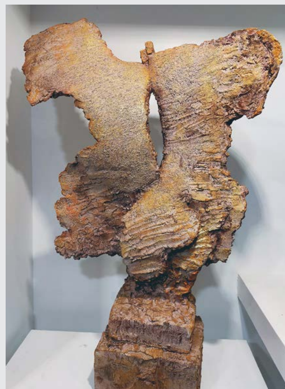
« Alliance, argile chamotté, cuisson 1200°, patine après cuisson »

«Je vis la création comme une expérience méditative qui me conduit au-delà d'une apparence.»