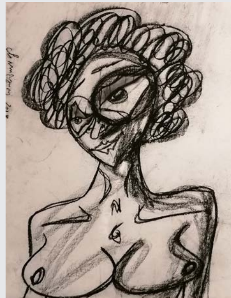
« Temps et visages »

Souvenirs, élans, marques du passé... Avec un stylo, un crayon, je nourris mon esprit d'une muse que j'inscris sur du papier. Je nourris un rêve, des douleurs, une cicatrice mais ses yeux m'appellent. Son âme danse dans ma tête. Seul, il me reste son image. Le temps passe, et sa voix claire résonne encore. Peu de couleurs, mais beaucoup de passion. Des portraits, et de l'émotion.