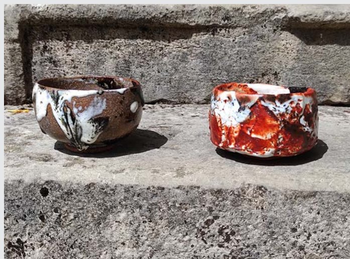
« Sans titre »