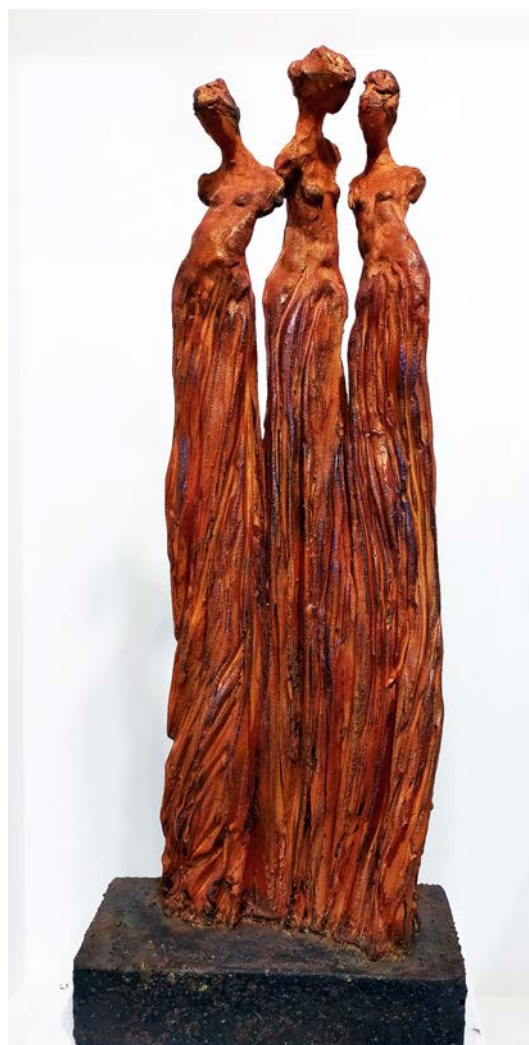
« Aludra, argile chamotté, cuisson 1200°, patine après cuisson, socle métal »

Les effets de matière m'intéressent particulièrement, en sculpture comme en peinture.»