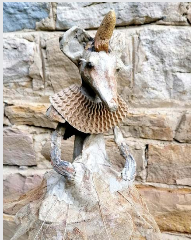
« La grande souris »

Son univers s'inspire des artisans antiques et des artistes premiers. Il réaliste aussi des bijoux d'artiste en bronze (fonte à la cire perdue) et plus récemment des broderies des dessins sur feuilles de bois et un travail autour du tissage.