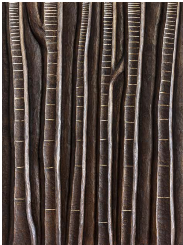
« Au fil du temps »

Le bois est mon matériau préféré auquel je reviens sans cesse comme un tropisme, nourriture de tous mes sens et de ma créativité. Bien au-delà de ses qualités physiques, il est le lien entre la vie et la création, le temps et l'espace. Symbole inépuisable des mythes d'hier et des enjeux de demain, il est le lien parfait entre Nature et Culture. J'aimerais que chaque sculpture révèle un morceau d'invisible et contribue à baliser le chemin de compréhension sensible du Monde pour les êtres humains.