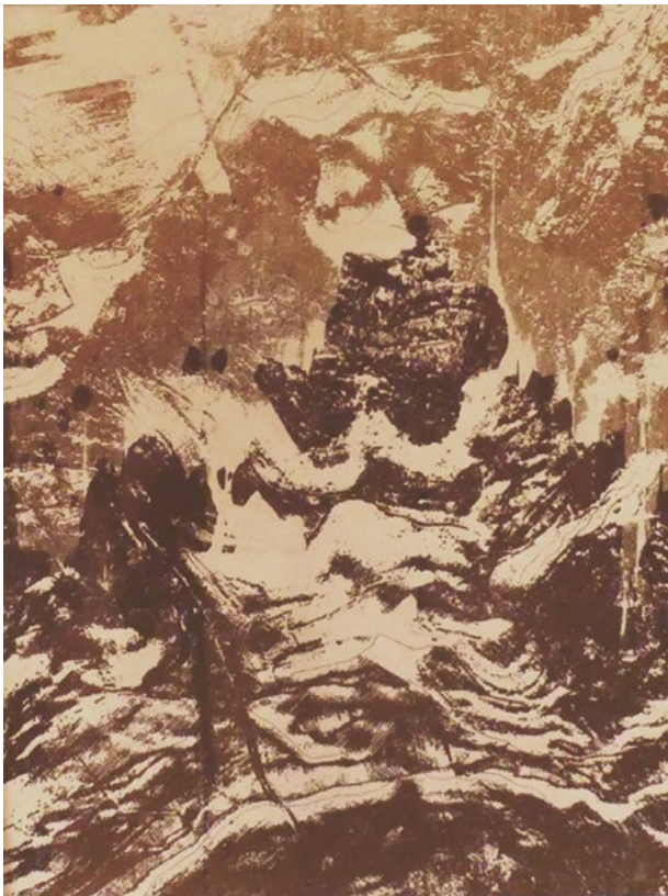
« Topomorphisme »

Mes œuvres s'attachent à construire des ponts entre la science et l'art. L'univers des cartes et du relief qui m'est familier et dont on peut explorer toute la richesse des formes avec l'outil informatique, au hasard des jeux de lignes et d'ombres, des formes étonnamment vivantes se révèlent et me font penser aux visions des chamanes. Une autre topographie qui m'a inspiré est celle du corps humain exploré par l'imagerie médicale. Une vision augmentée qui ne dit rien de ce qui nous habite et nous meut.