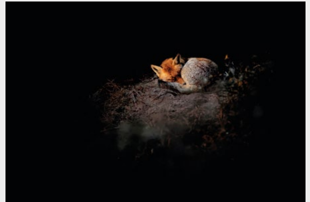
« Le Temps des Chimères »