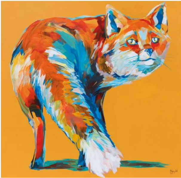
« Qui me suit ? » Renard