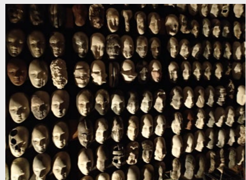
« Délire de faciès », 2022, 300x80 cm