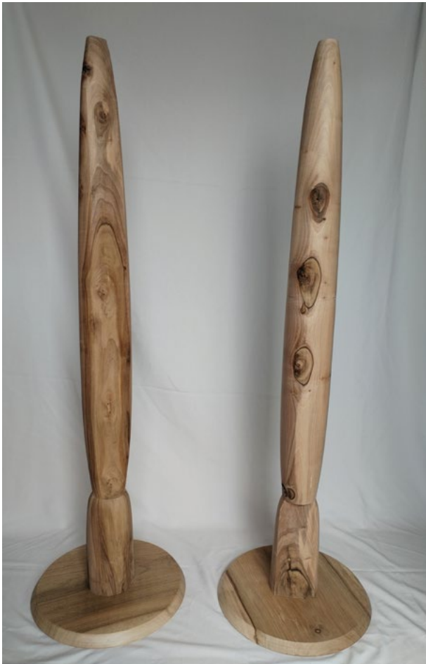
« Les papotants », 2024, tournage, 130x30 cm

Je travaille essentiellement des matières renouvelables comme l'absurdité, le dadaïsme, la poésie, l'écriture, la colère, parfois des matières démodées telle que la non violence et j'essaie de mélanger ces ingrédients pour donner naissance à des formes que l'on appelle moyen d'expression.