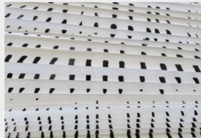
« Pieghe e punti »

Dans mon travail je développe un dialogue entre l'espace, le geste et la ligne. Hasard et nécessité du tracé. Prise en main de la recherche simultanément à l'exécution. Je fouille l'espace pictural ou, plus largement l'espace plastique, afin d'y révéler rythmique, transparence, affirmations tendues, lectures multiples des plans, architectures sensibles, une écriture du monde perçu peut-être. Je cherche un essentiel déplacement de sens, d'espace, une percussion poétique.