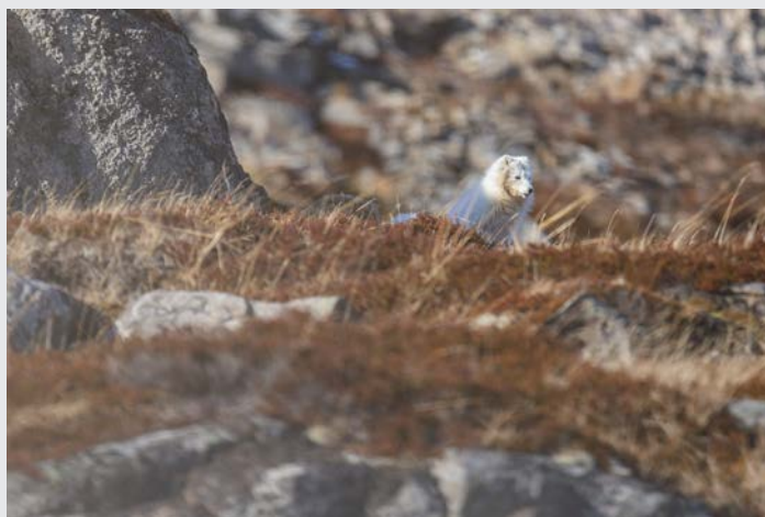
« Tundra spirit »

«Hestur, cheval en terre d'Islande» est son premier livre photo. Il travaille actuellement sur le genre Vulpes, celui des renards, sous leurs différentes formes.