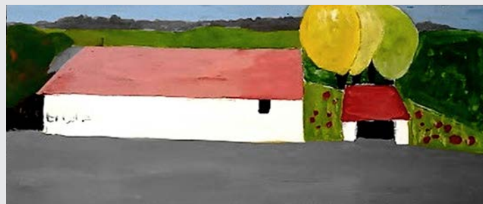
« Jura »

Peinture et Illustration, de très nombreux sujets sont abordés. Avec des traits et formes volontairement réduits, ce langage tend à rendre l'essentiel d'une impression, d'une expérience.