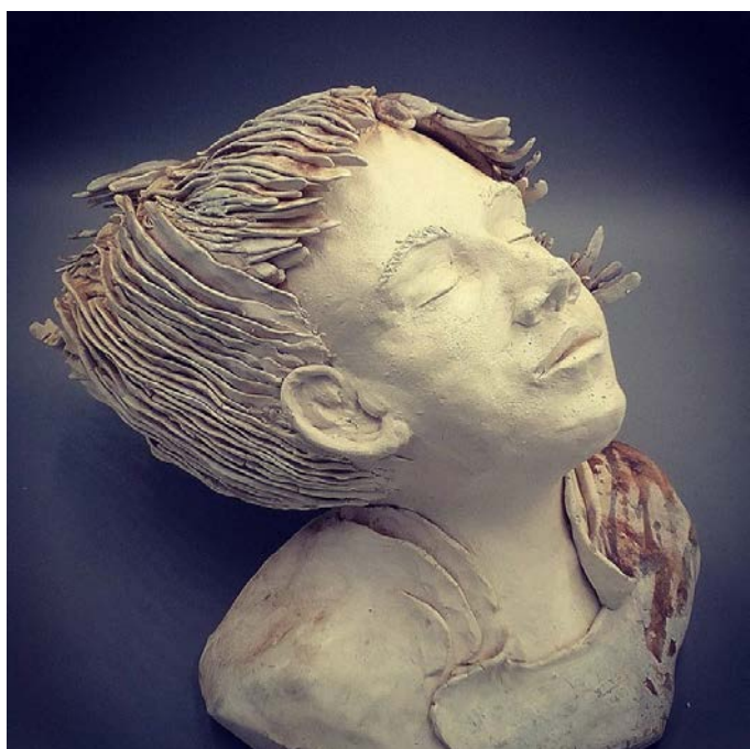
« Respire »

Elle laisse transpirer ses émotions de ce qu'elle voit et de ce qu'elle ressent, ce qui lui permet de s'inspirer et de réaliser des pièces tournées et modelées.