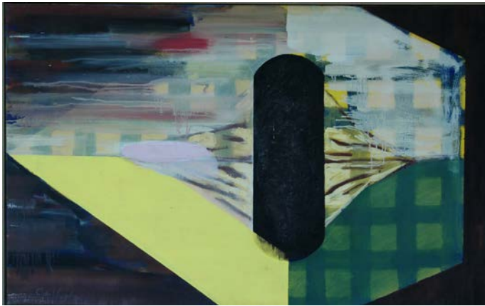
« L'invention »

Je travaille surtout d'une façon abstraite. Les couleurs, leur tonalité et leurs relations réciproques sont importantes. J'aime travailler avec la matière, les structures, l'expression. J'essaie de ne pas trop me répéter, chaque œuvre est un individu et doit avoir son caractère.