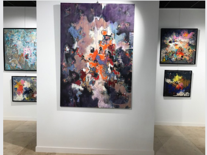
« Sans titre »