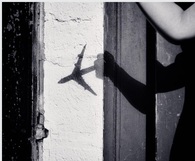
« Sans Rendez-Vous »