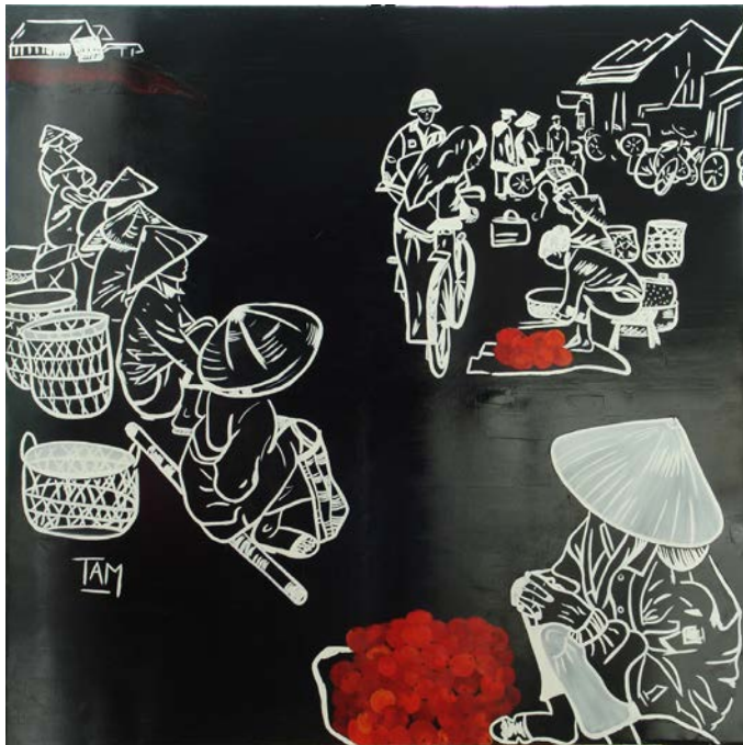
« Marché de Hanoi »

Bien au-delà d'une représentation, la peinture, la sculpture puis la photo interviennent comme le support de ses émotions, l'écriture de ses sentiments.