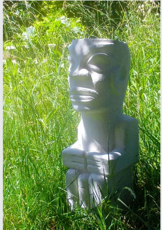
« Tiki »

J'enfile mes palmes, masque, tuba virtuels et plonge dans un monde où le règne animal, fantastique ou irréel prend enfin toute sa place... (Et ouf que ça fait du bien !!!!!) Entre fourmis guerrières, araignées géantes et Tikis, je me repose et apprend une autre langue!